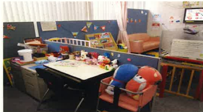
どのぬいぐるみがすきかな~)o^(