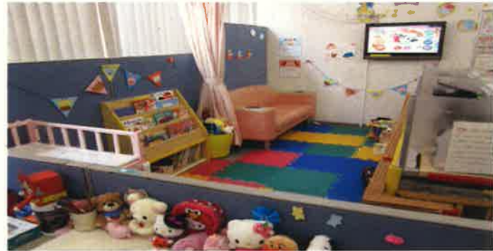
見守りスタッフが目配りしています!(^^)!

マザーズハローワーク熊本 〒860-0844 熊本市中央区水道町8-6 朝日生命熊本ビル1F(くまじョ7内) TEL:096-322-8010 【開庁時間】9:00~17:30(土・日・祝日は閉庁)