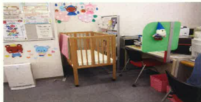
お母さん、お仕事探しがんばってzzz