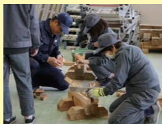
▲大工工具の使い方

大工道具を使って、基本作業の技能及び知識を習得します。 ● のこぎり、のみ等の大工道具の使い方 ● 丸のこ、足場の取扱い ● 木造住宅の骨組み製作