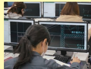
▲ CAD による図面作成

建築CADを使った図面作成に関する技能及び関連知識を習得します。 ● 2次元 CAD の使い方 ● 建築図面の作成