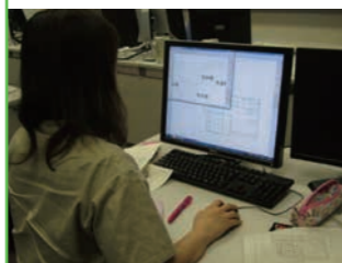
H29年6月修了生 (20代 女性)

会社としては戸建ての外構（エクステリア）の設計から施工までを行っています。その中で CAD オペレーターとして、顧客のイメージを図面にしたり、意匠に関して提案したりしています。その他 3次元 CAD によるパースや見積書の作成も行っています。