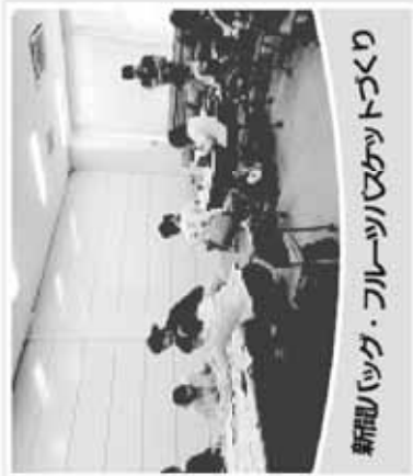
新聞バッグ・フルーツバケットづくり