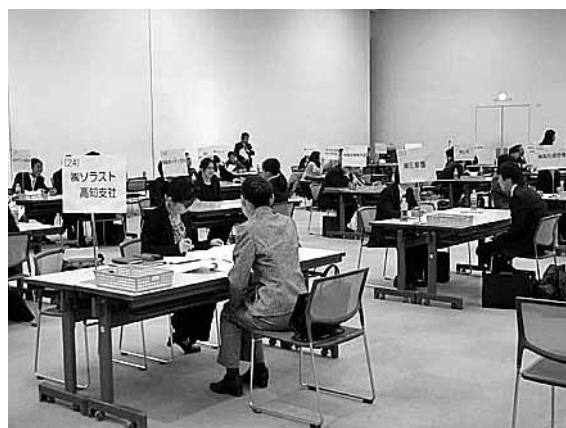
（高知市会場のようす）