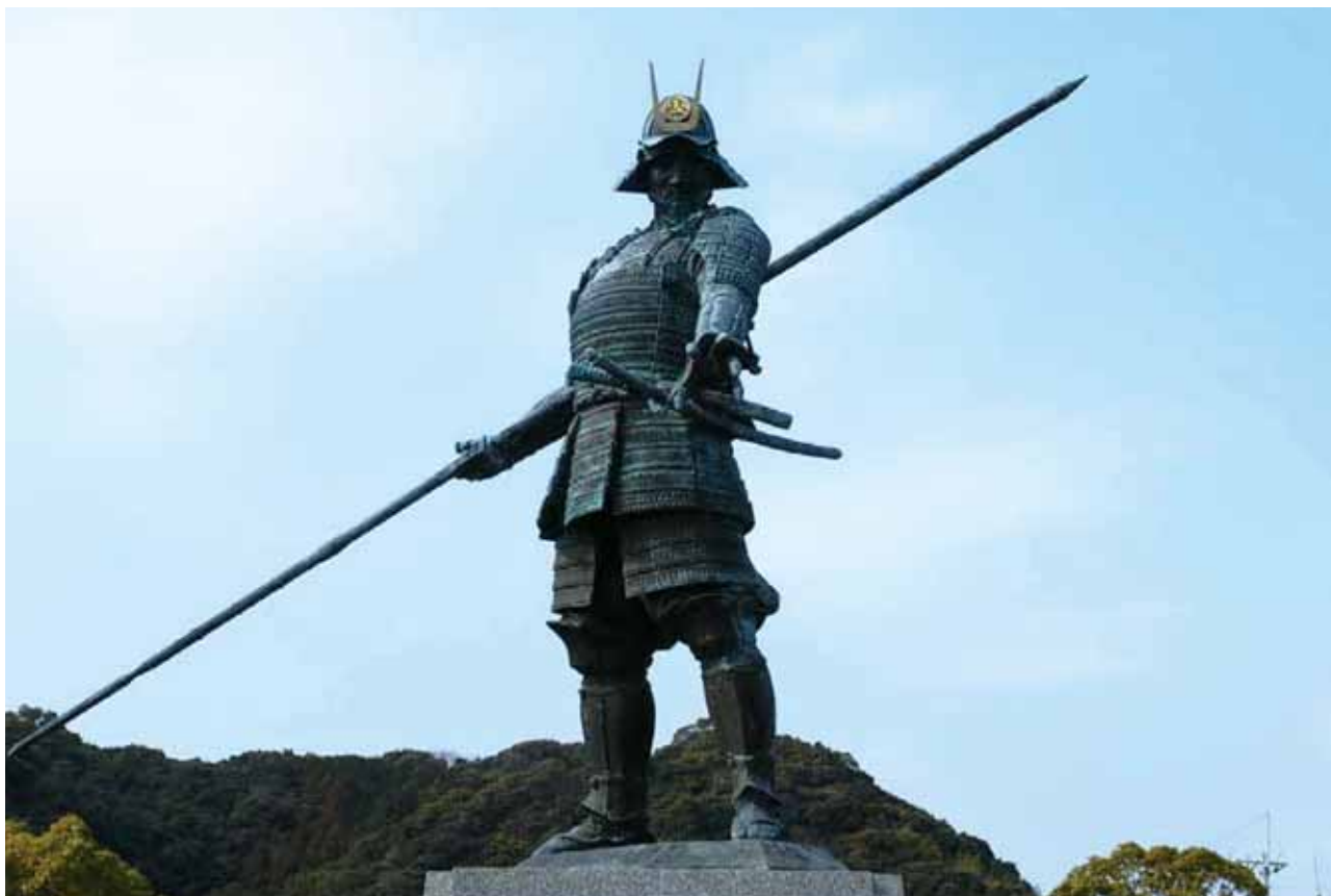
長宗我部元親公 初陣の像 (高知市長浜)