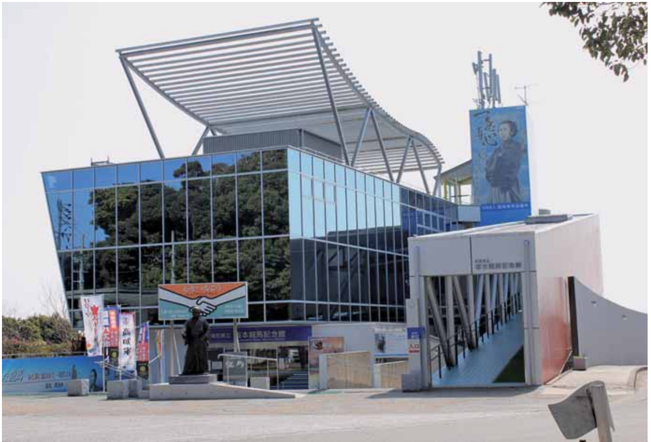
坂本龍馬記念館（高知市浦戸）