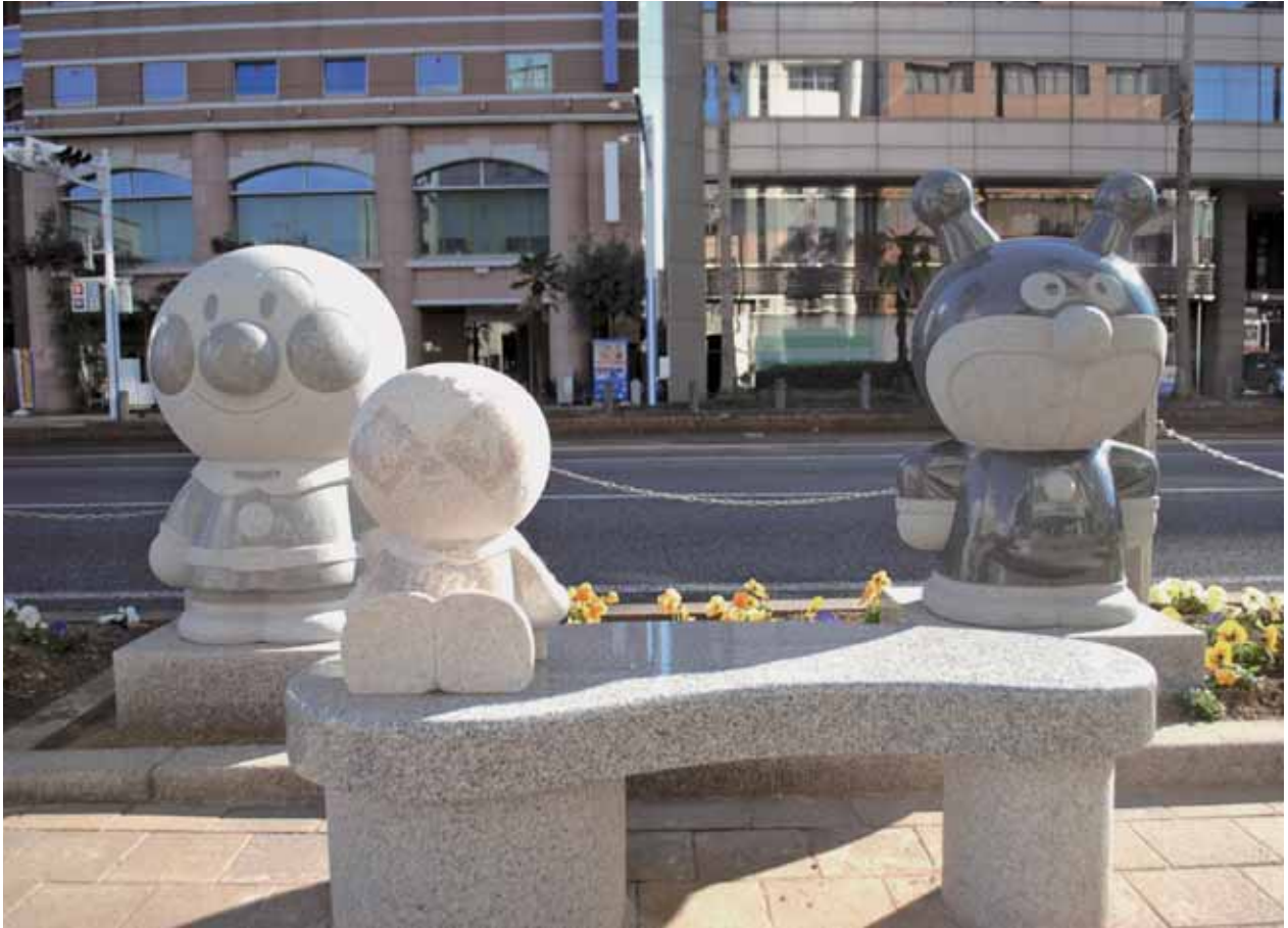
アンパンマンキャラクター石像（高知市駅前町）