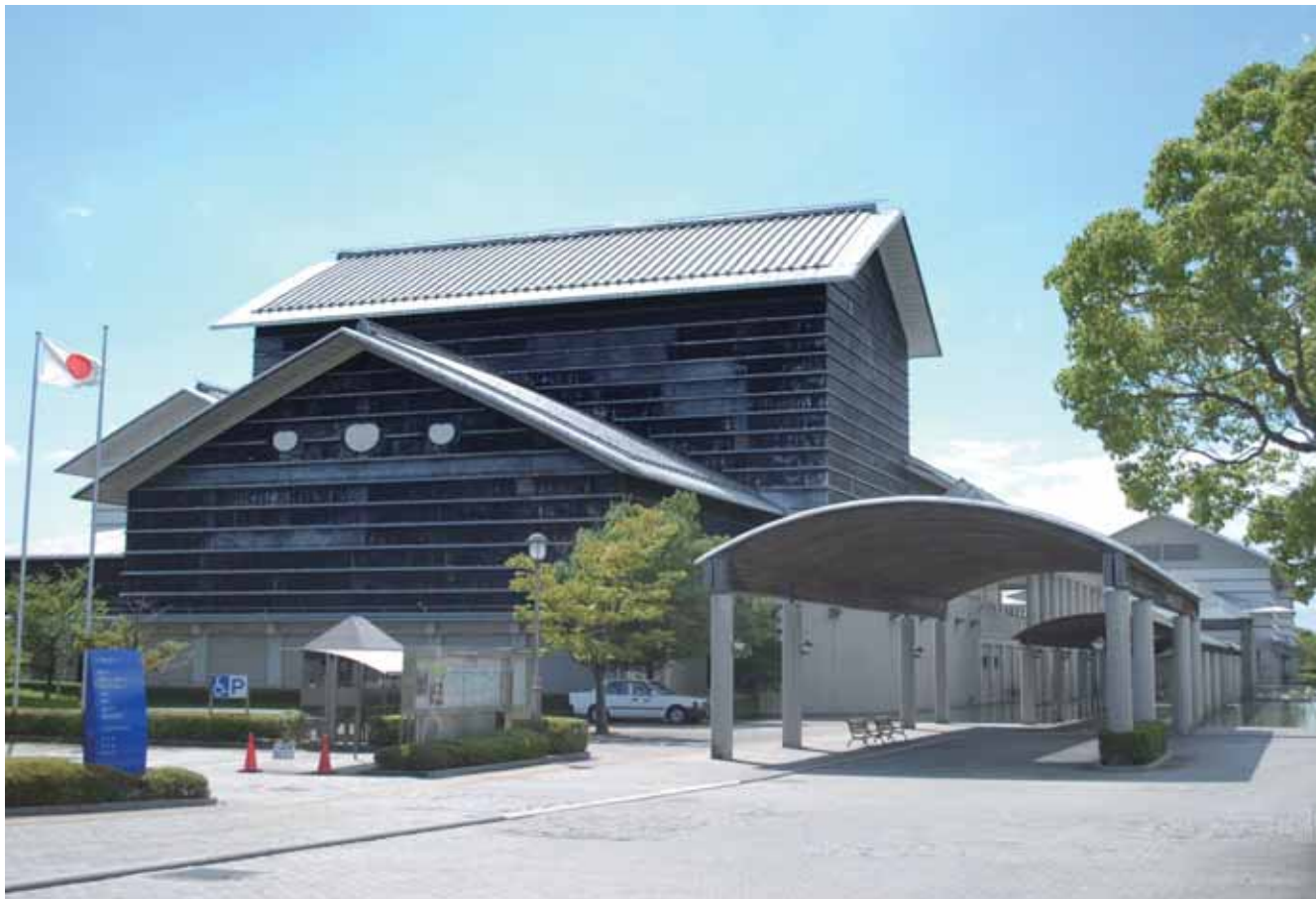
高知県立美術館（高知市高須）