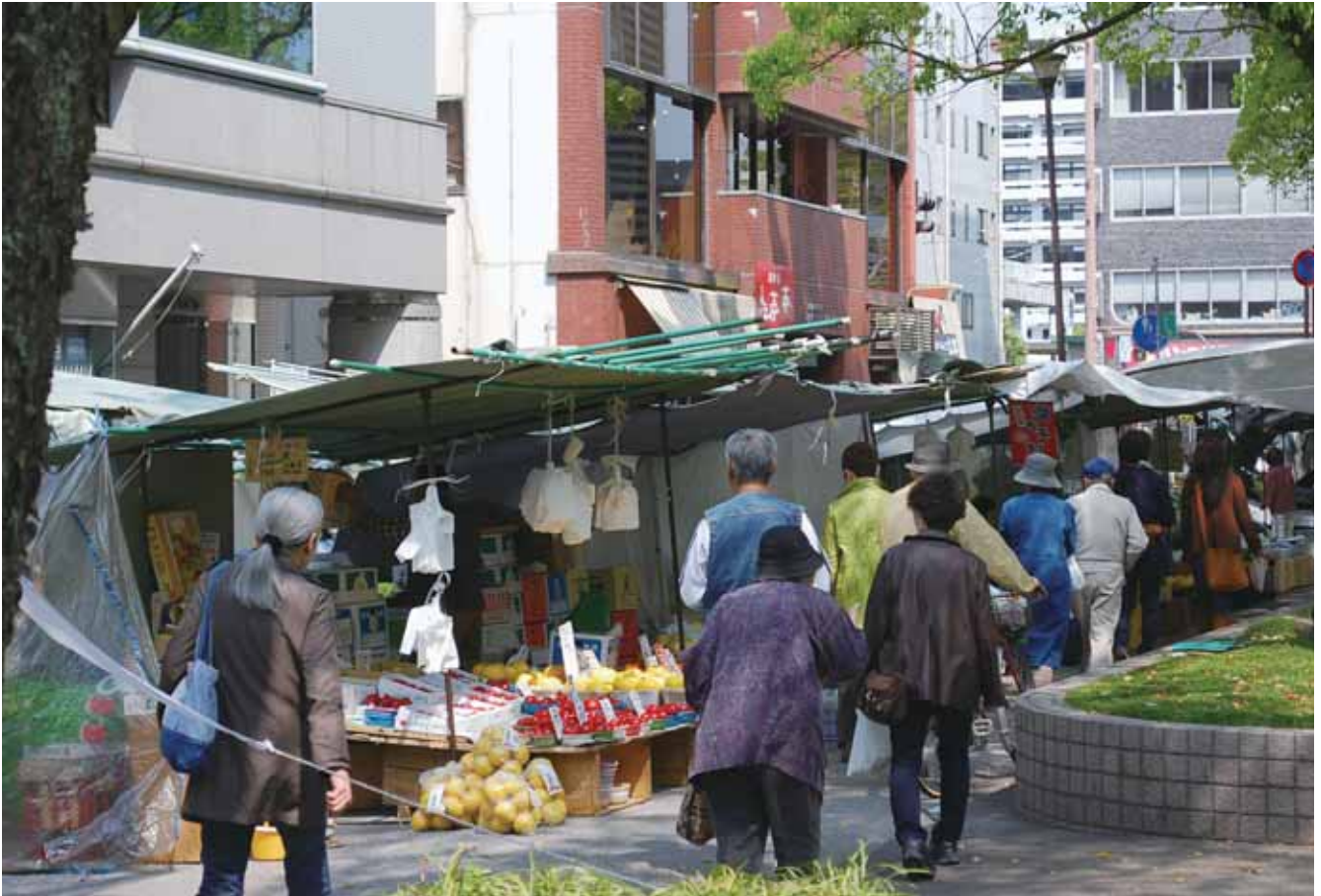
木曜市（高知市本町・県庁前）