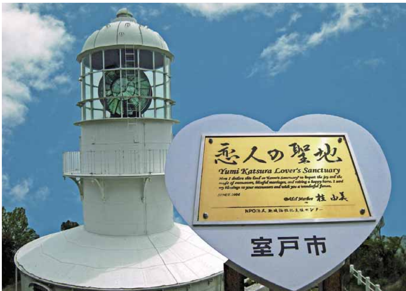
室戸岬灯台と恋人の聖地（室戸市）