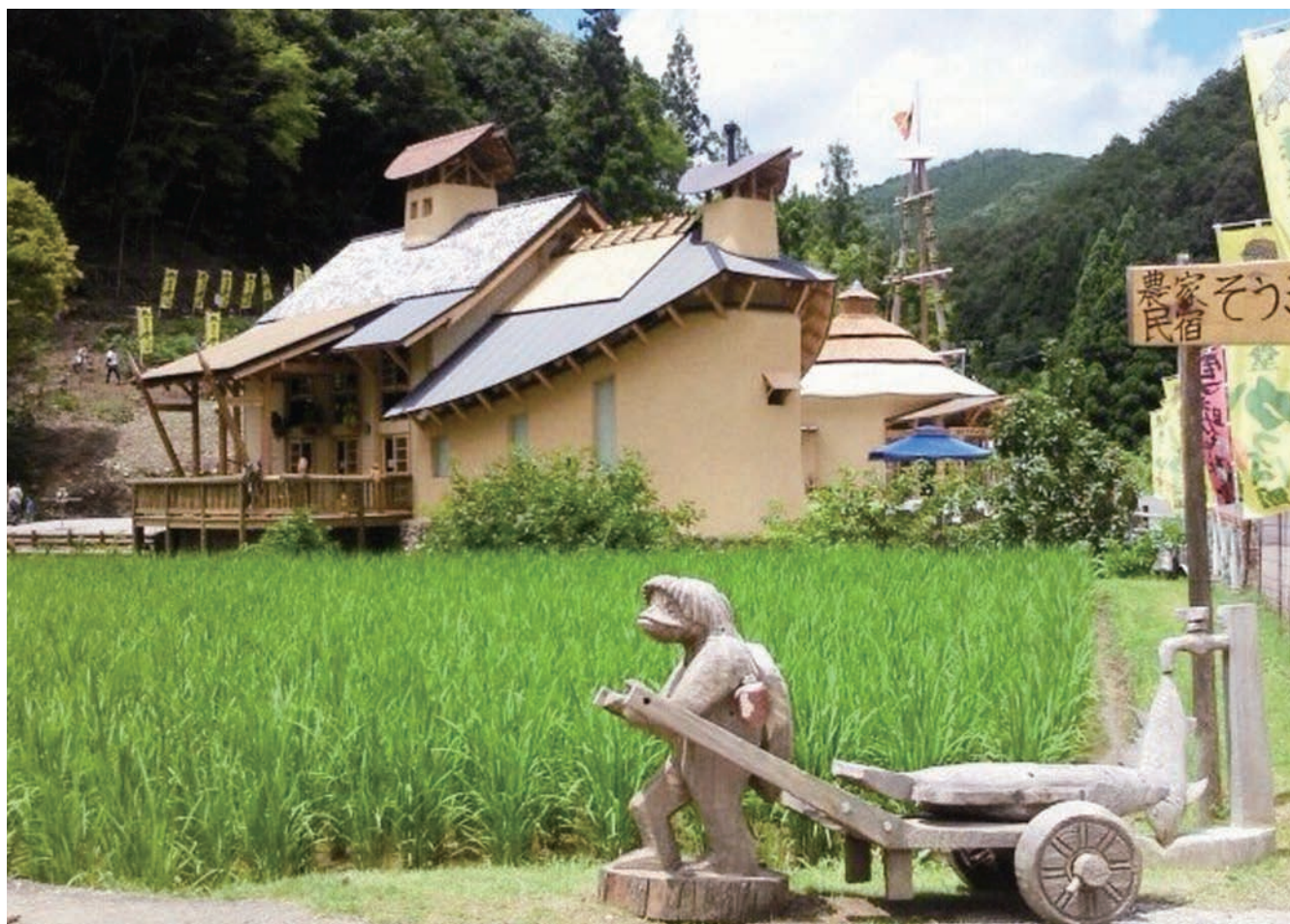
海洋堂かっぱ館（四万十町）