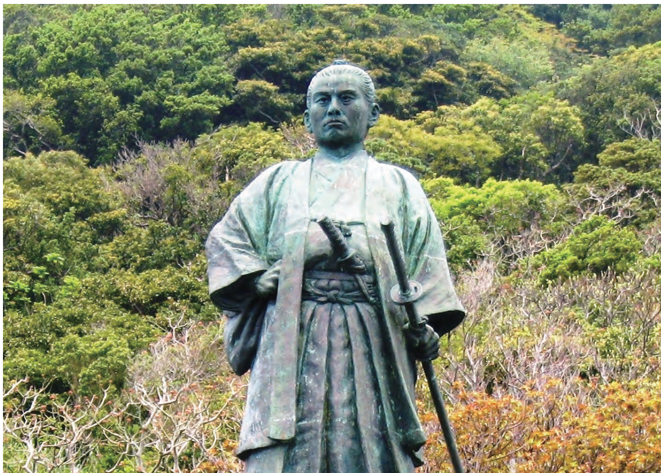
中岡慎太郎像（室戸市）