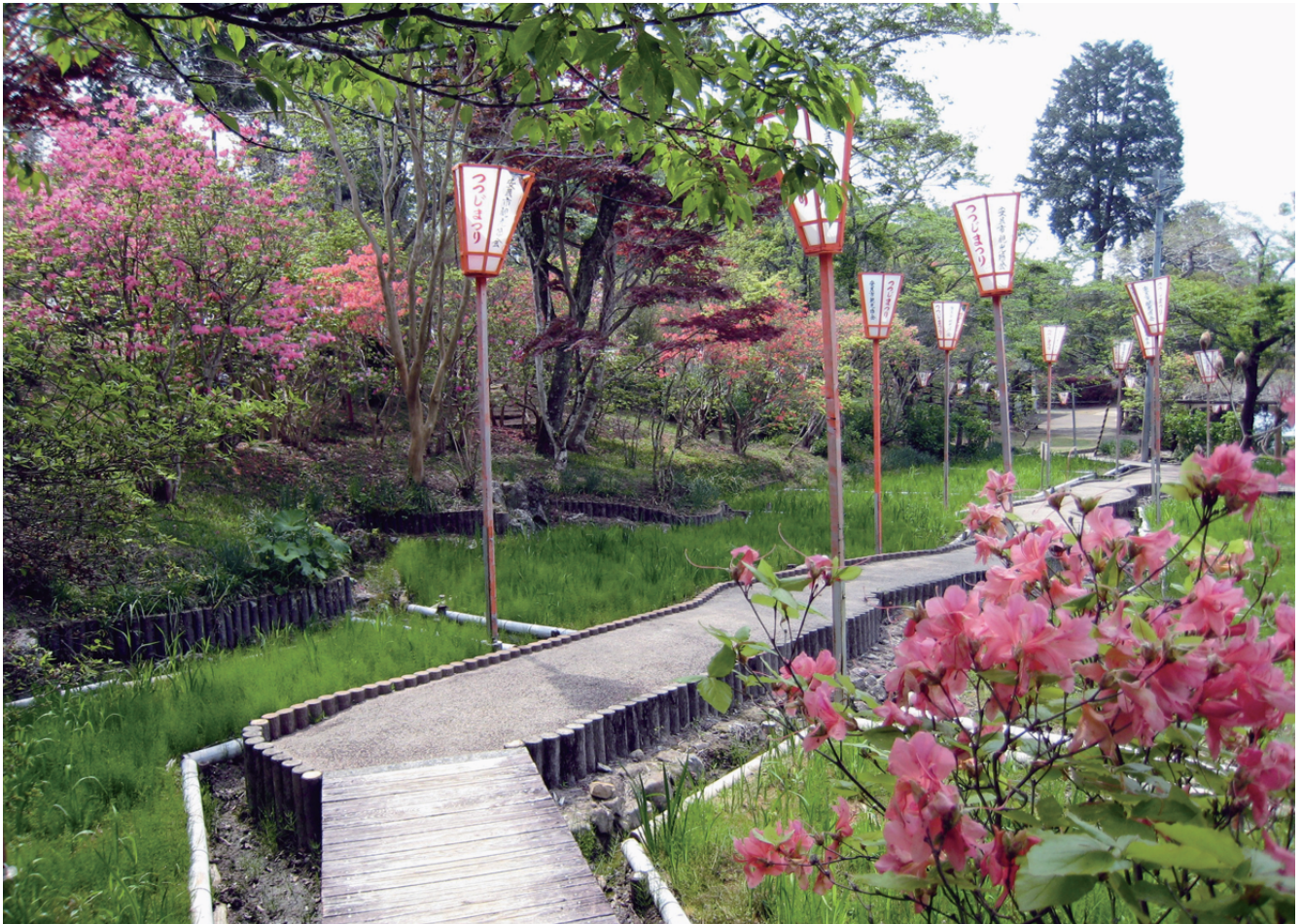
内原野公園 (安芸市)