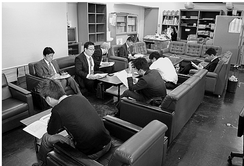
（報道発表のようす）

高知労働局ホームページURL http://kochi-roudoukyoku.jsite.mhlw.go.jp/