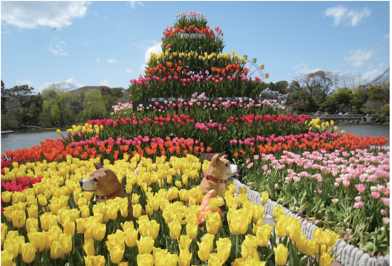
わんぱーくこうち (高知市棧橋通)