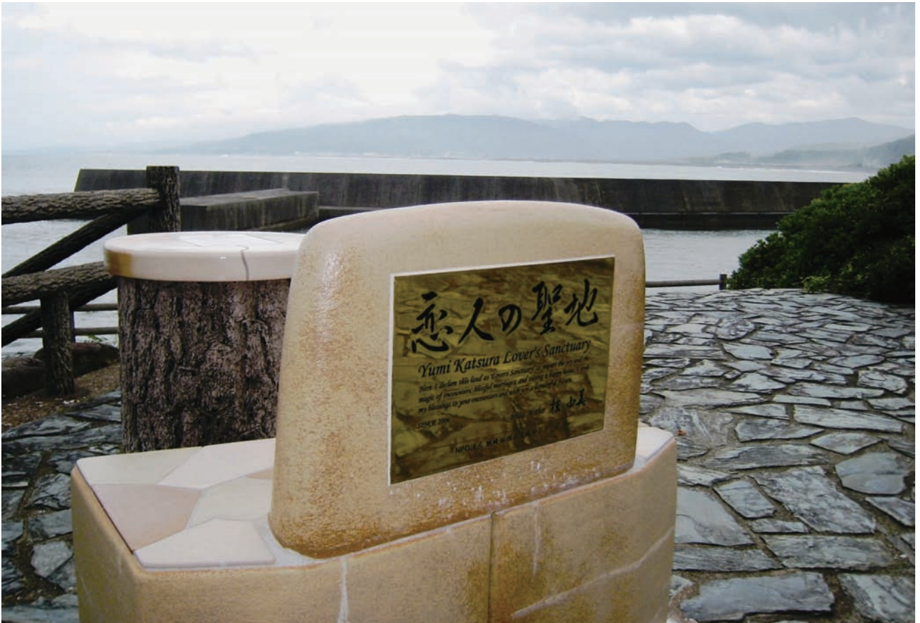
恋人の聖地（安芸市下山）