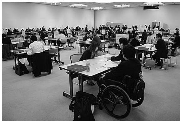
(かるぽーと会場のようす)

平成23年10月の高知県内の有効求人倍率が0.62倍と厳しい雇用失業情勢が続く中、介護関係職種については有効求人倍率が高く、雇用の受け皿として期待されているところです。