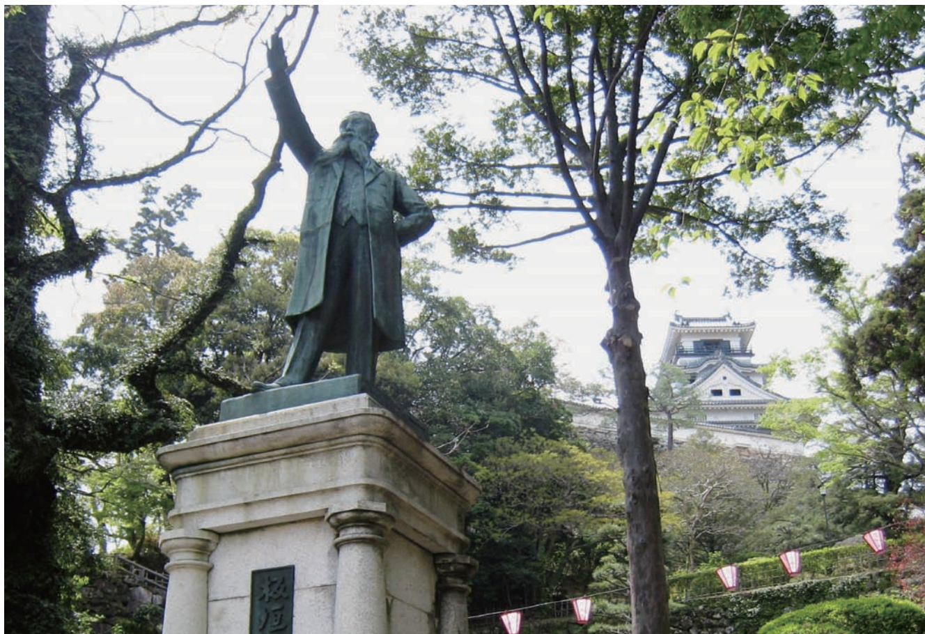
板垣退助像と高知城（高知市）