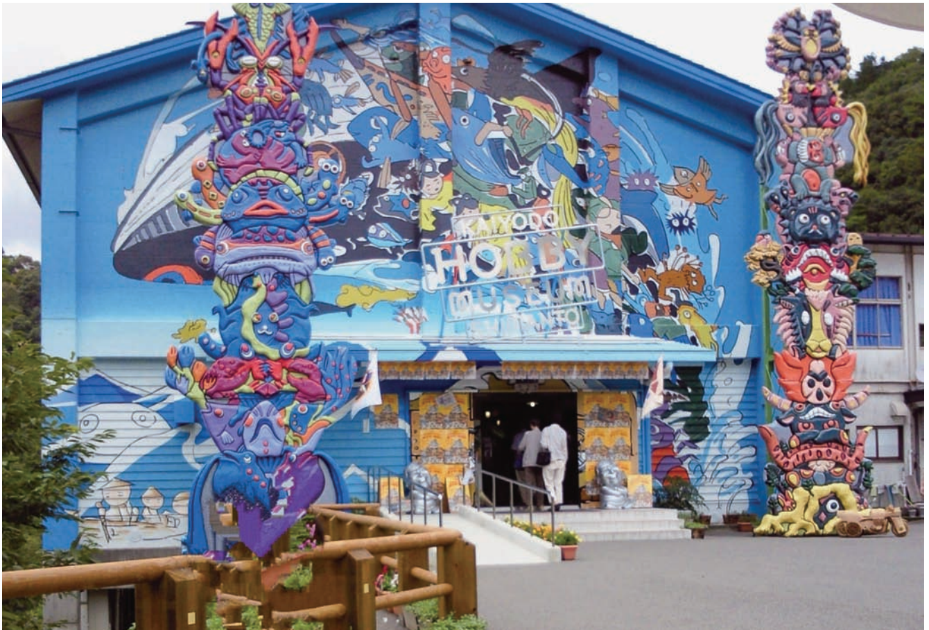
海洋堂ホビー館四万十（四万十町）