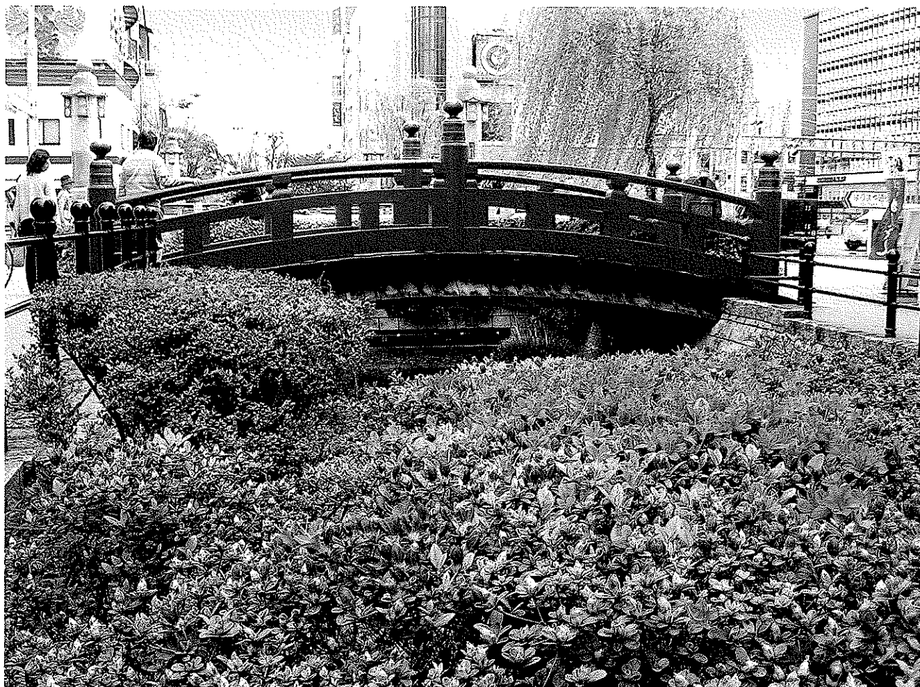
「はりまや橋(高知市)」