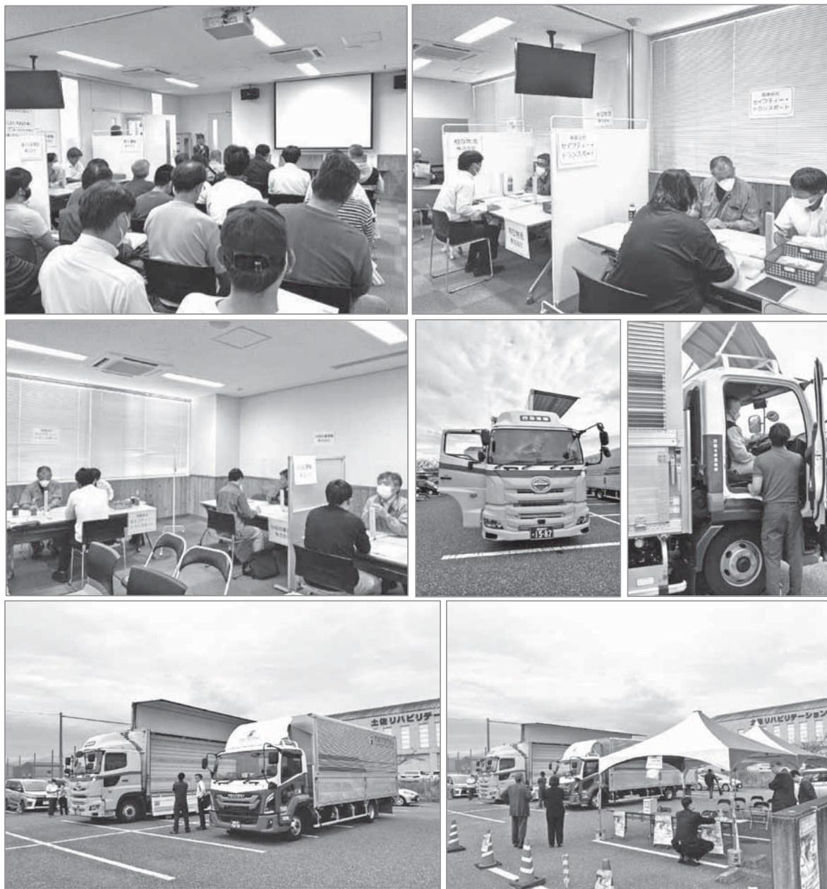
【会場】ハローワーク高知 参加企業：7社 参加人数 23人

トラックドライバーの業務にご興味のある方は、ぜひお近くのハローワークまでお問い合わせください。