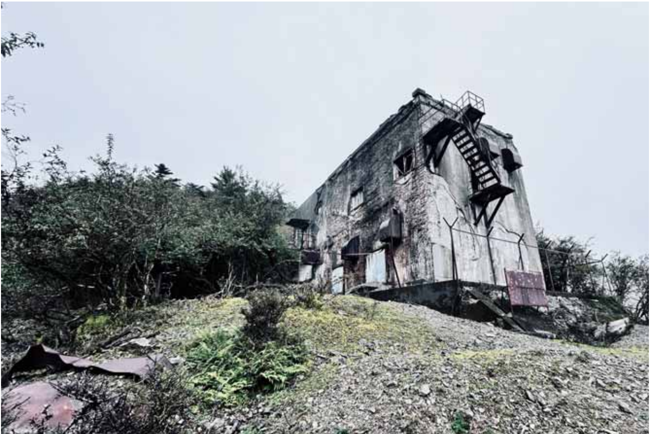
(松尾無線中継所跡 香北町)