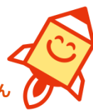
ハロートレックン