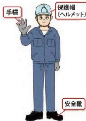
作業者に身につけてほしい望ましい装備例