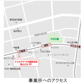
事業所へのアクセス