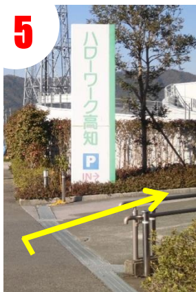
この看板を右折すると玄関に到着！