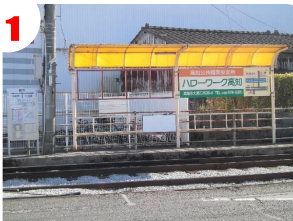
とさでん電停「新木」で降ります。