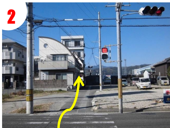
横断歩道を北に渡ります。