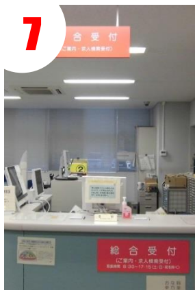
右側に総合受付があります。「学卒コーナーを利用したい」と伝えて下さい。