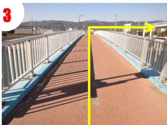
②の突き当りの橋を渡って右折します。