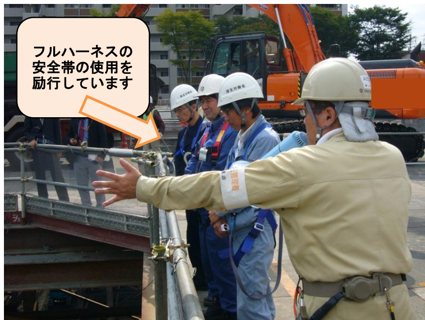
取組状況を確認する実施者

これをきっかけに、市内事業場の皆様に今一度、労働災害防止の重要性について認識をさらに深め、職場環境をより安全に、より快適にさせていただくことで、労働災害防止及び健康障害防止のための取組を自主的かつ積極的に促進し、労働災害の減少を図ることを目的としています。