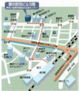
アクセス：戸塚、東横線、みなとみらい線、京浜線、相模線、市営地下鉄 （横須賀線より徒歩約5分）