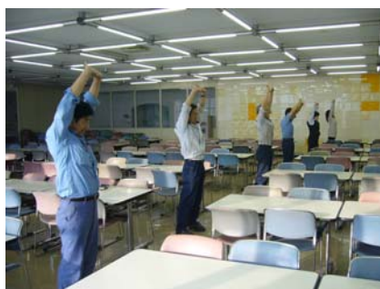
リフレッシュ体操