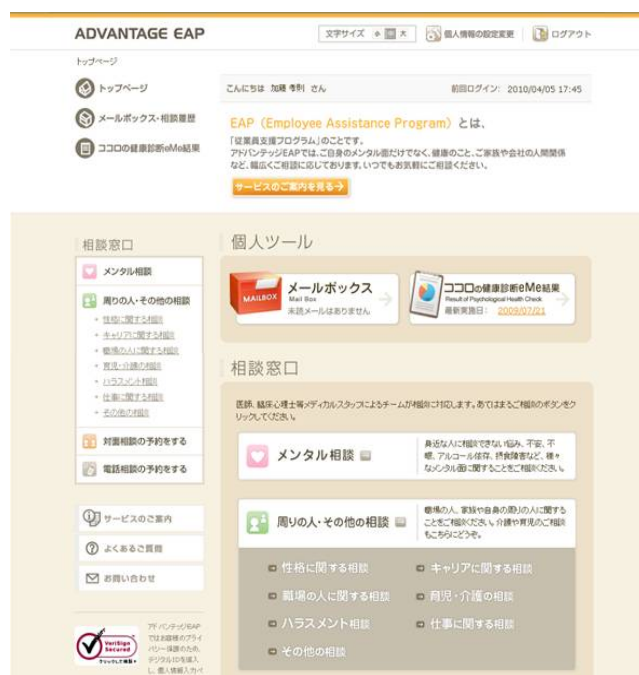
EAP(こころの健康診断)

メンタルヘルス障害で休職してしまった人がうまく職場に復帰できるよう、リハビリ出勤制度があります。産業医、看護師、家族、職場、人事部が連携して復帰の時期、方法を検討、実施しています。