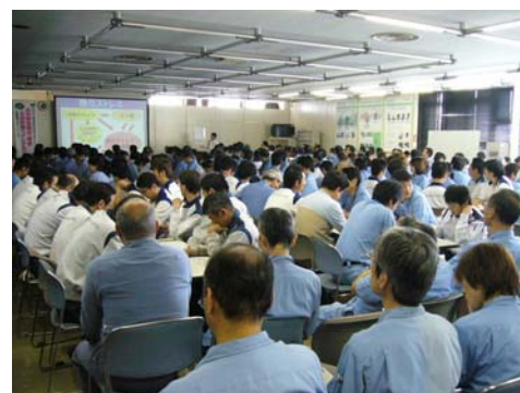
労働衛生週間の産業医の衛生講話

また、年1回、労働衛生週間の実施事項として、全従業員を対象とした講話を行なっています。最近では、生活習慣病、メンタルヘルス、食生活などをテーマとして採り上げました。