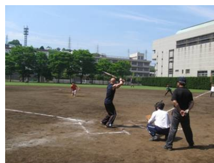
THAイベント(ソフトボール大会)