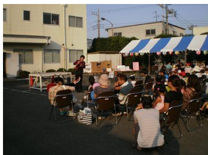
相模工場 夏祭りの様子