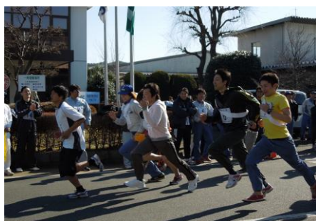
相模工場 駅伝大会の様子

運動習慣作りや社内のコミュニケーション促進による健全な職場作りを目的として、各種レクリエーション活動を実施しており、2011年度は相模工場駅伝大会・ソフトボール大会・ボーリング大会・納涼祭等を開催しました。