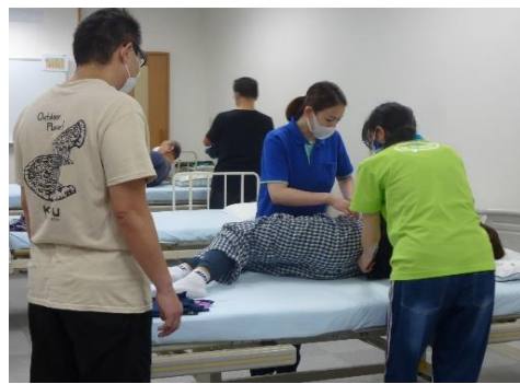
介護実践室での授業の様子