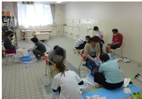
入浴実践室での授業の様子

介助者の腰痛を予防し、利用者が安全・安心・安楽に介助を受けられる技術、ボディメカニクスの基礎を習得します。