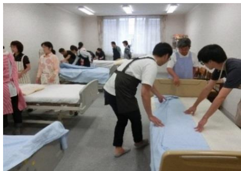
介護実践室での授業風景です。