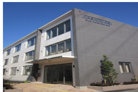
校舎全景です。(南東より)