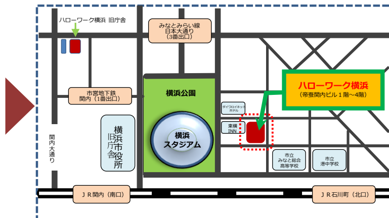
JR関内駅より徒歩6分、石川町駅より徒歩5分、地下鉄関内駅より徒歩8分、みなとみらい日本大通りより徒歩8分