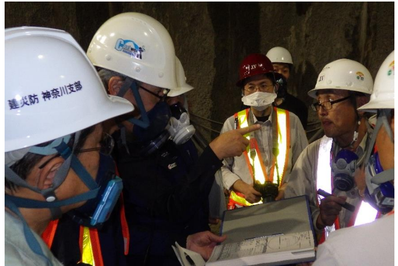
写真右：ずい道等内部の地山の点検状況を確認しています。