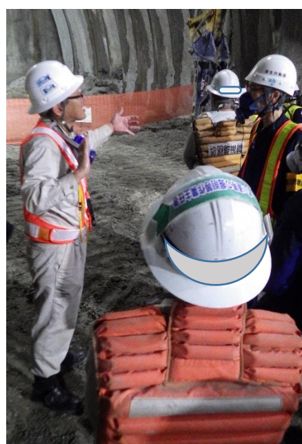
写真右：バックプロテクター（写真手前及び奥のベスト調の保護具）の装着状況