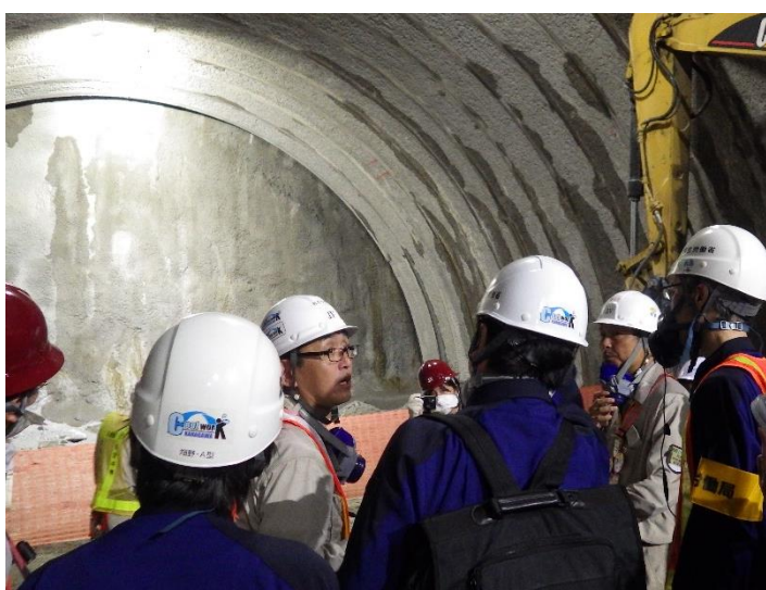
写真左：切羽における肌落ち災害防止対策の説明を受けるパトロール員