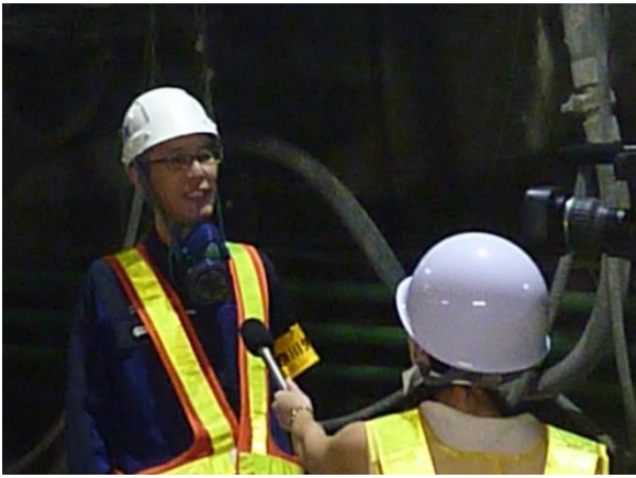
写真左：テレビ神奈川のインタビューの様子です。