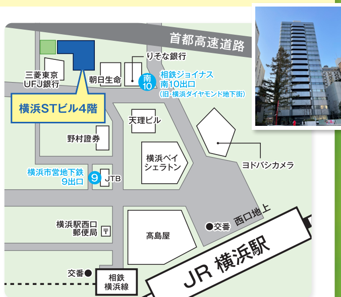
横浜市西区北幸1-11-15 横浜STビル4階