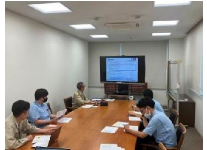
社内教育を少人数で実施