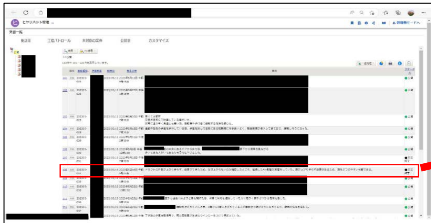
ヒヤリハット管理画面

従来は、ヒヤリハットを書類で回覧、対策を実施していましたが、デジタル化による回覧にて、リアルタイムでヒヤリハットを閲覧、進行状況を確認できるようになりました。併せて、対策責任者が明確化となり、対策漏れがなくなりました。