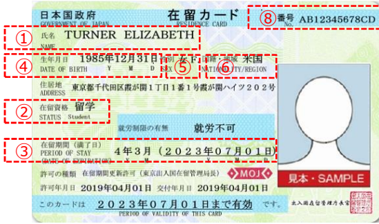
在留カード例（表面）