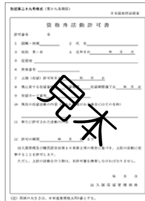
※3 資格外活動許可書