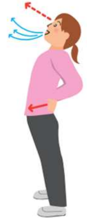
⑥腰反り ストレッチ