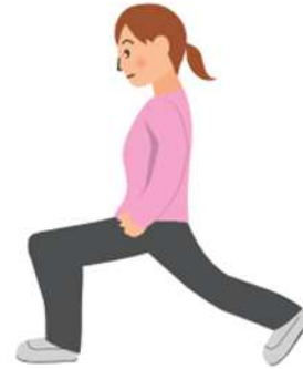
④股関節とお尻の ストレッチ