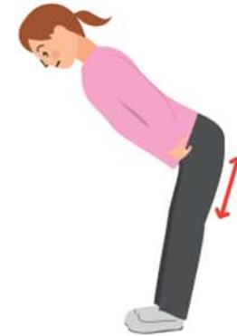
⑤胸と太ももの ストレッチ