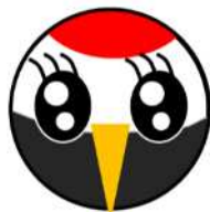
鶴見労働基準監督署 安全衛生推進キャラクター つる美ちゃん