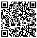
動画 転倒・腰痛予防!「いきいき健康体操」解説書 (令和元年度厚生労働科学研究費補助金 労働安全衛生総合研究事業「エビデンスに基づいた転倒予防体操の開発およびその検証」の一環として製作) この体操は第94回全国安全週間鶴見地区推進大会でも実演していただきました。