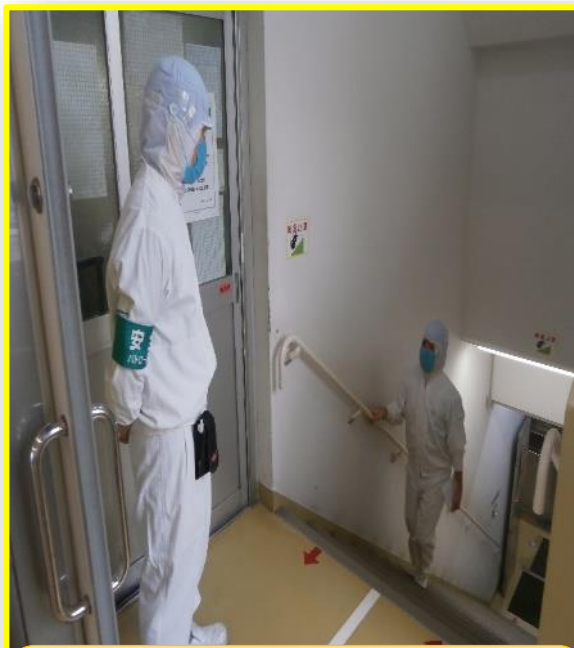
当番制での声掛け