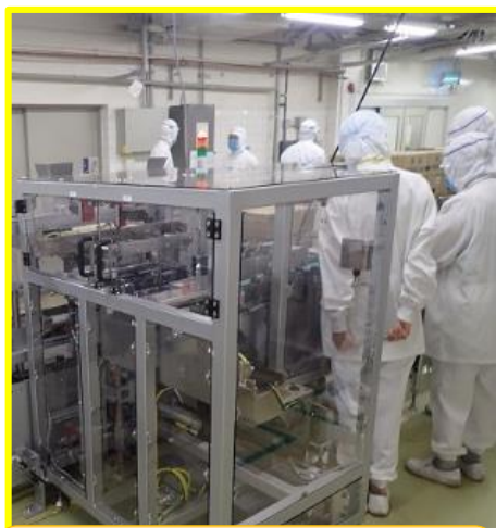
導入前・稼働前 リスクアセスメント