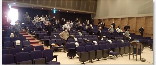
「エイジフレンドリーガイドラインの体力チェック」に関して、実際に参加者が基本動作を体験しました