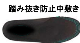
踏み抜き防止中敷き