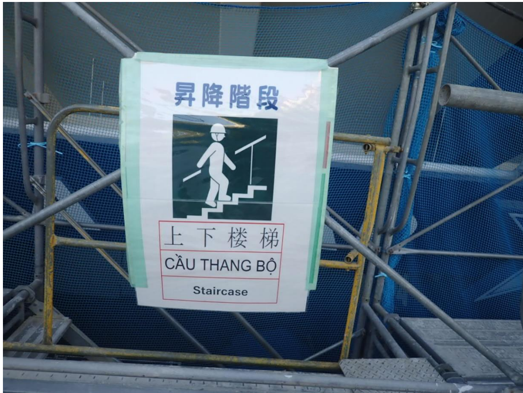
外国人労働者に配慮した表示