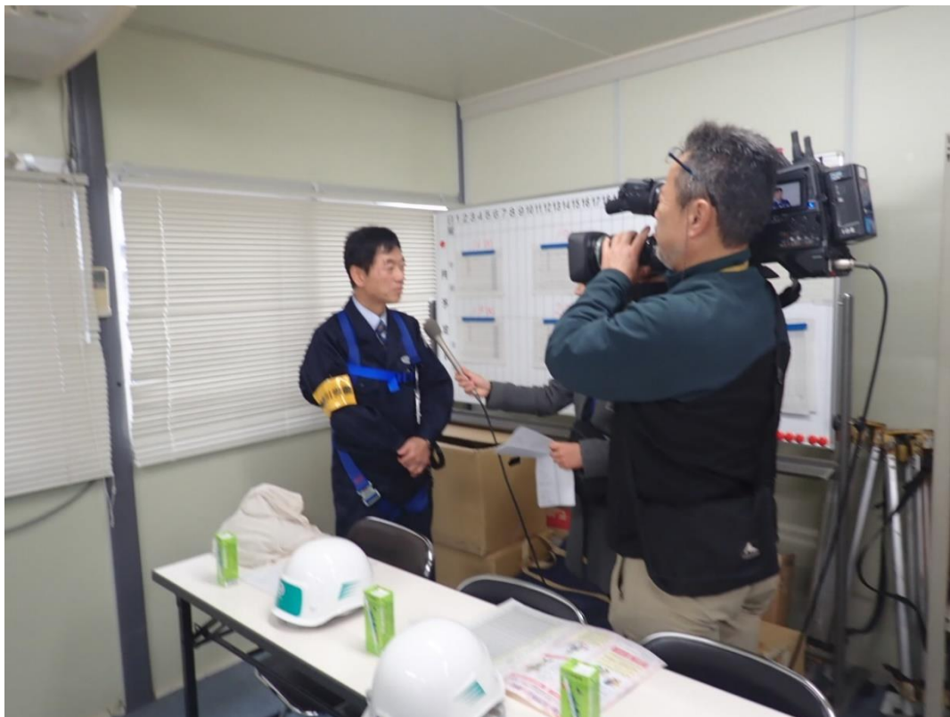
パトロールの後、テレビ神奈川のインタビューを受ける局長