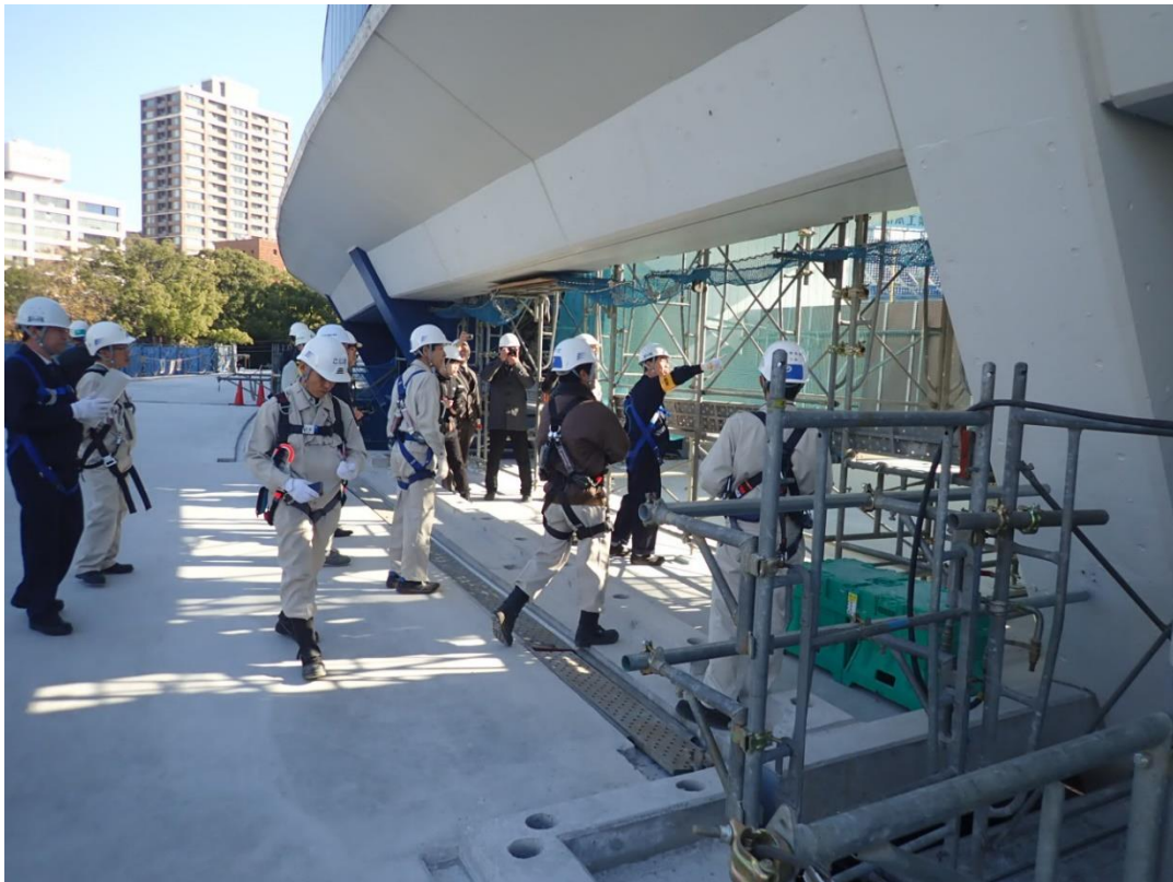
足場の墜落防止措置が適切に講じられている。