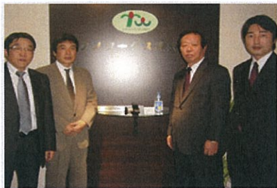
【私達にお任せください!!】