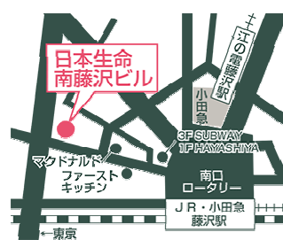
藤沢オフィス 他2拠点