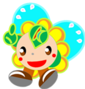
ハローワーク川崎 マスコットキャラクター はなさきちゃん