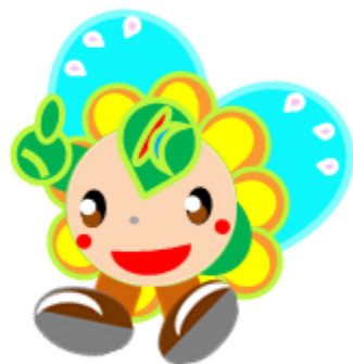
ハローワーク川崎 マスコットキャラクター はなさきちゃん