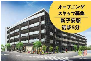
オープニング スタッフ募集 新子安駅 徒歩5分

新子安駅徒歩5分！全員同期で一から関係を築けるチャンス。風通しの良さが自慢。最高の絆を！