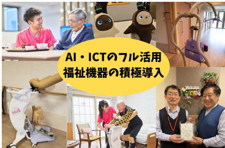
AI・ICTのフル活用 福祉機器の積極導入