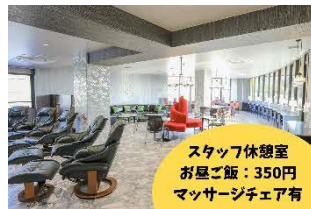
スタッフ休憩室 お昼ご飯：350円 マッサージチェア有