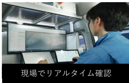
現場でリアルタイム確認