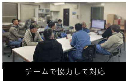
チームで協力して対応