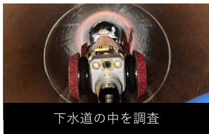
下水道の中を調査