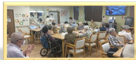
▲広々と開放感のあるフロア ▼利用者の方と七並べ