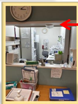
全体が見渡せます