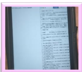
▲定型文や音声入力出来る タブレット