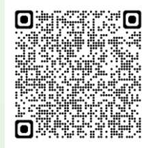
セントケア神奈川