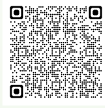
セントケアRe-has永田台