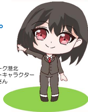
ハローワーク港北 マスコットキャラクター はろうめさん