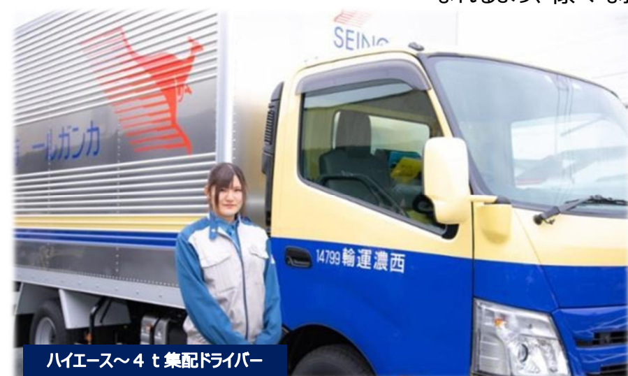
ハイエース～4t集配ドライバー