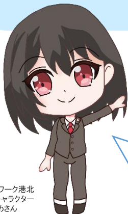
ハローワーク港北 公式キャラクター はるうめさん